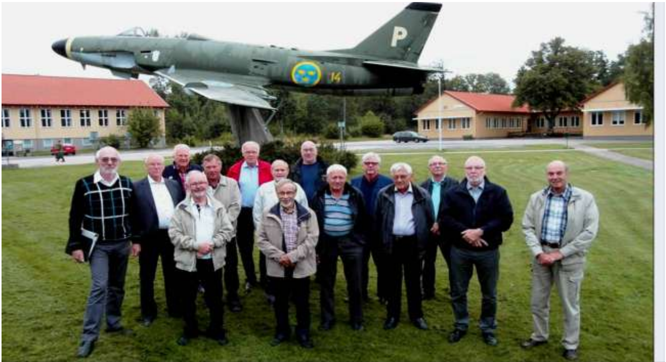
2013 Ändå mer mogna än på föregående foton vid årets 50-årsjubileum på FMTS i Halmstad