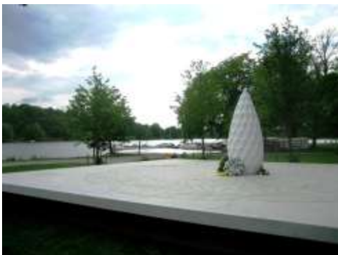
Till vänster: Veteranmonumentet på Gärdet i Stockholm intill Sjöhistoriska museet