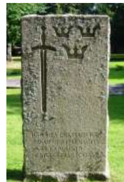
Till höger: Veteransten över avlidna soldater i Vadstena.