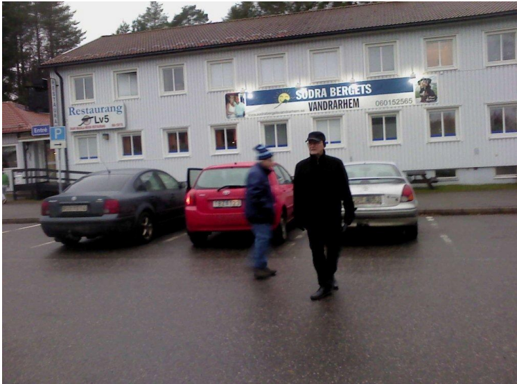
På Södra berget i Sundsvall regementsofficersmässen till vänster om kanslihuset.