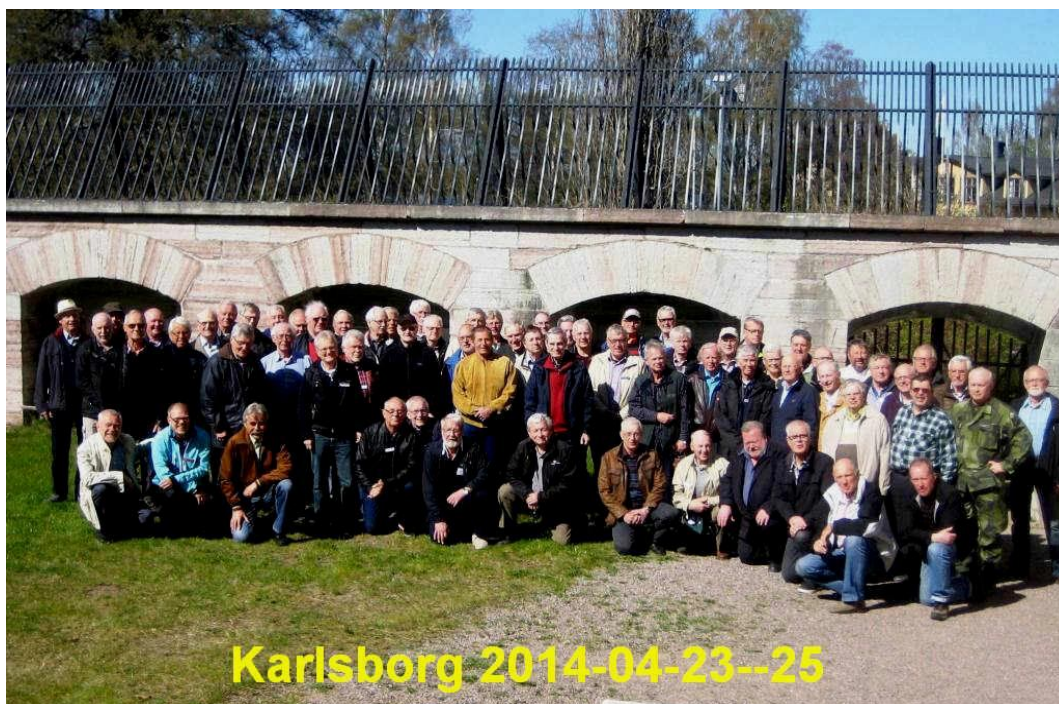
Deltagarna på Årsmötet 2014 i Karlsborg fick även pryda vår nya informationsbroschyr